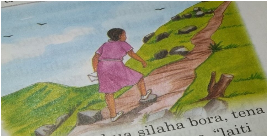
Picha 4: Mkwea Mlima - Nimefufuka (Ukurasa 17)