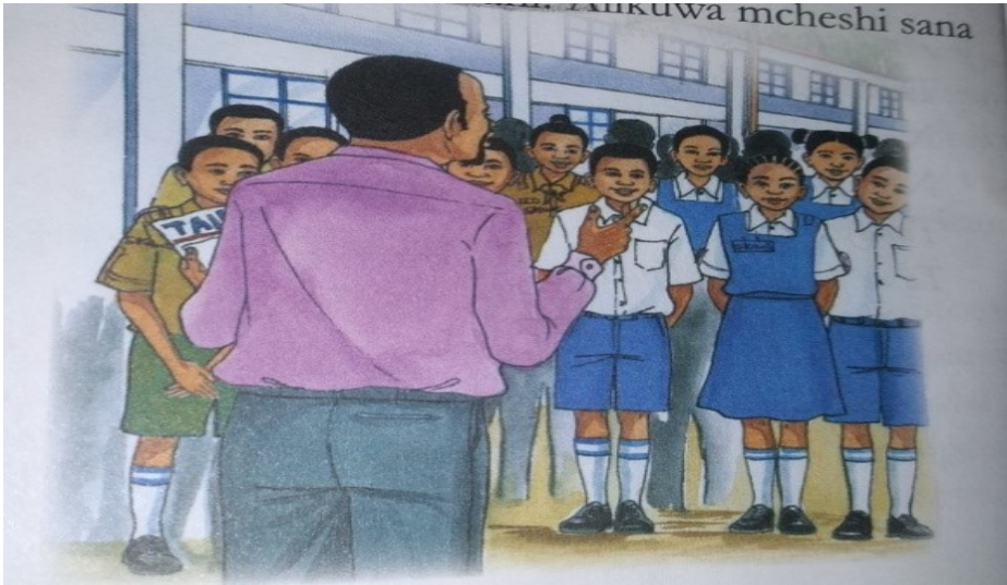
Picha 9: Watoto Wakishauriwa na Mwalimu Wao - Sitaki Iwe Siri (Ukurasa 18)

Hali hii pia imetumiwa katika Nimefufuka katika ukurasa wa 12 ambapo mwandishi anasema kuhusu mtoto Taabu anayebadilishiwa jina na kuwa Shujaa: