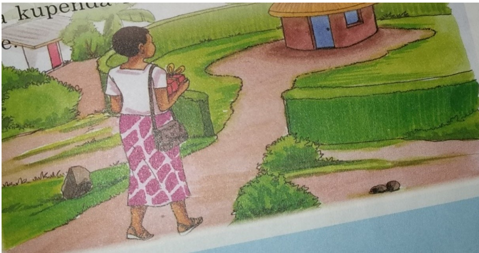
Picha 8: Chaurembo Akilelekea katika Nyumba Yake Mpya - Nimefufuka (Ukurasa 31)