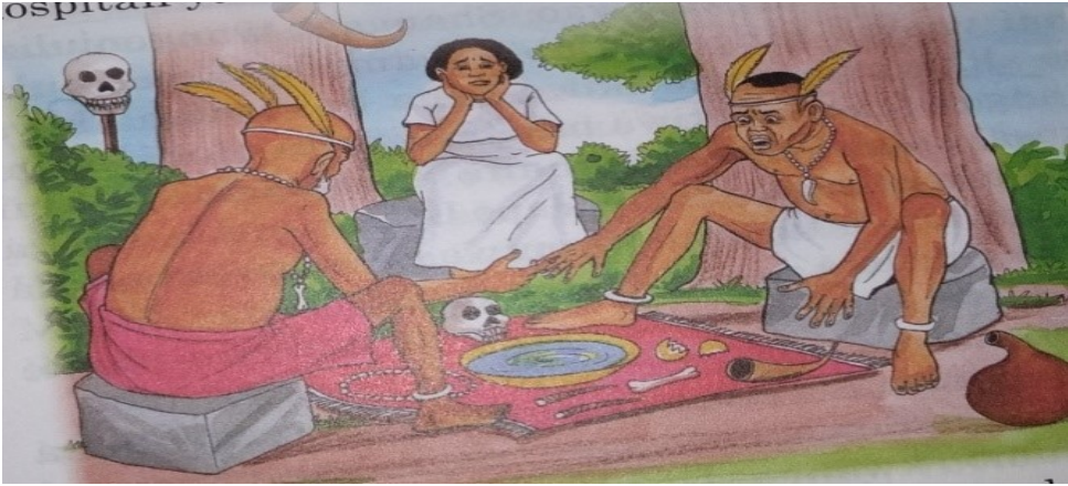
Picha 5: Mama ya Lena Akiwa kwa Mganga - Nimefufuka (Ukurasa 7)

kwa majonzi makubwa akisubiri kitendawili kiteguliwe. Kwa hivyo maelezo ya mwandishi yanajalizwa na picha ili habari hizi ziingie watoto akilini kwa urahisi.