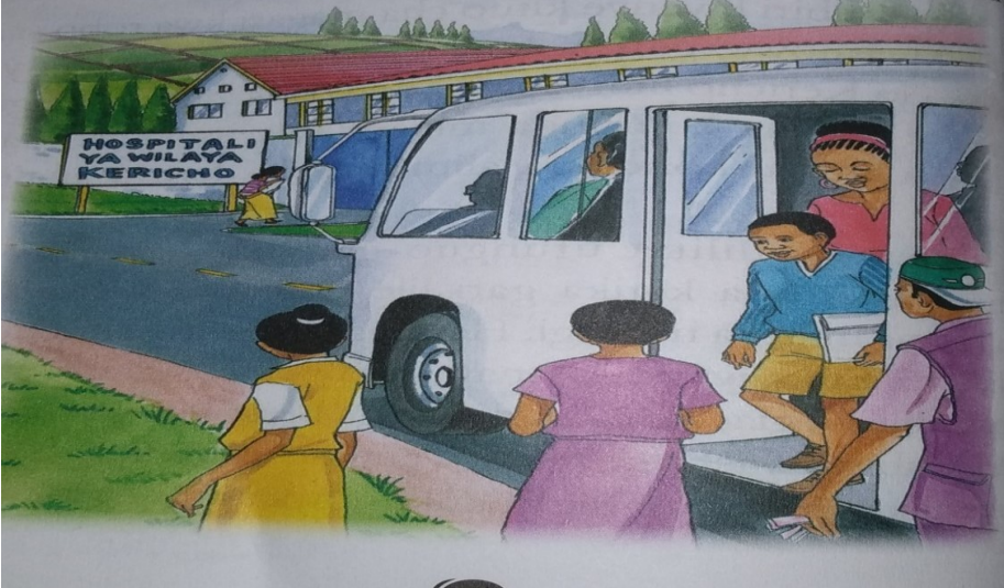
Picha 1: Utingo - Sitaki Iwe Siri (Ukurasa 30)

Baada ya maelezo haya mwandishi ametuwekea picha katika ukurasa huo inayoonesha abiria wakishuka kutoka kwenye gari. Katika picha hii pia kuna kondakta au utingo ambaye anafafanuliwa katika tashbihi tuliyotaja. Ni wazi kuwa lengo la picha hii ni kusisitiza maelezo haya.